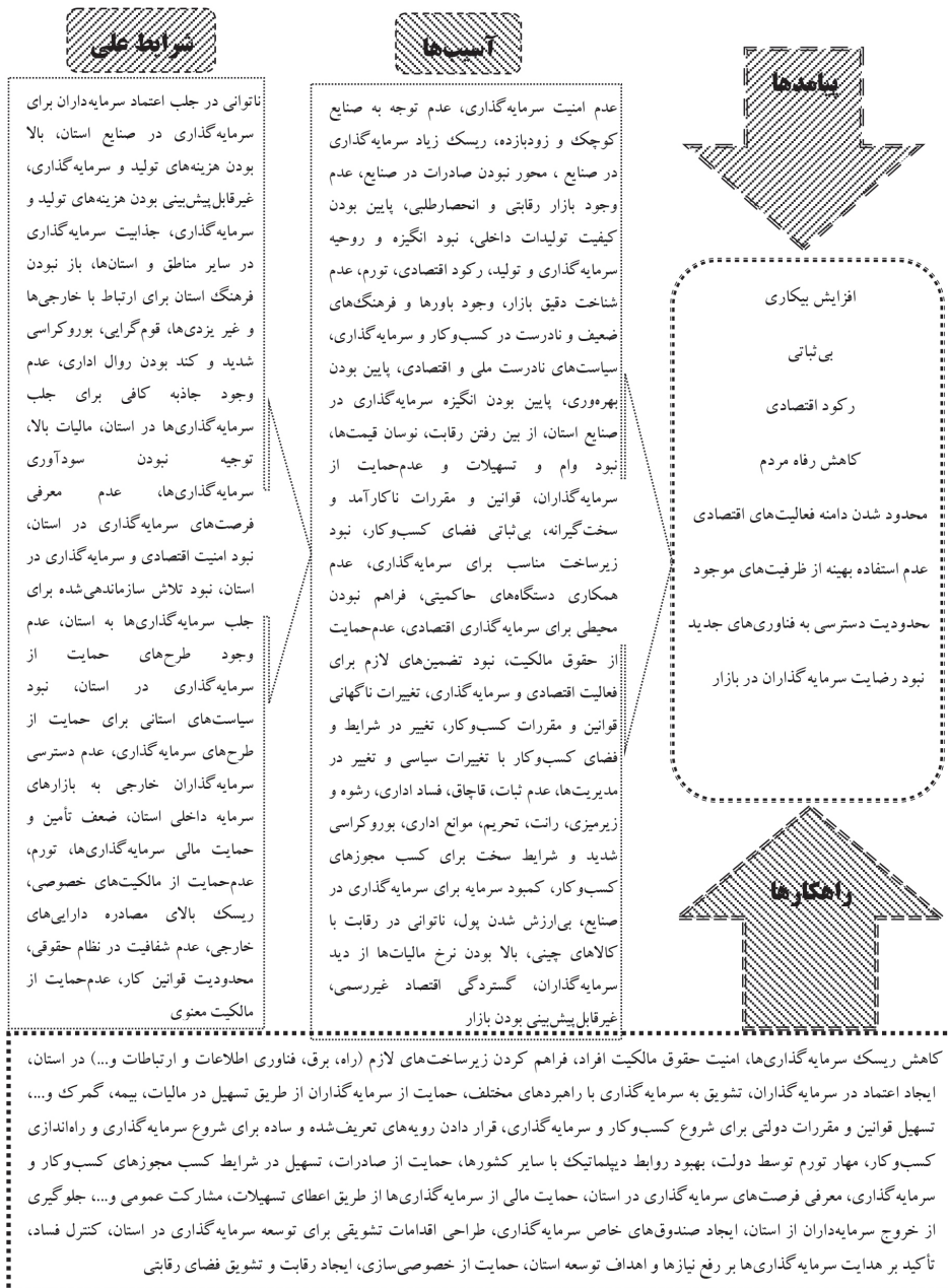
شکل (۲) یافته‌های حاصل از واکاوی روند بررسی آسیب‌های فضای کسب‌وکار در صنایع استان یزد