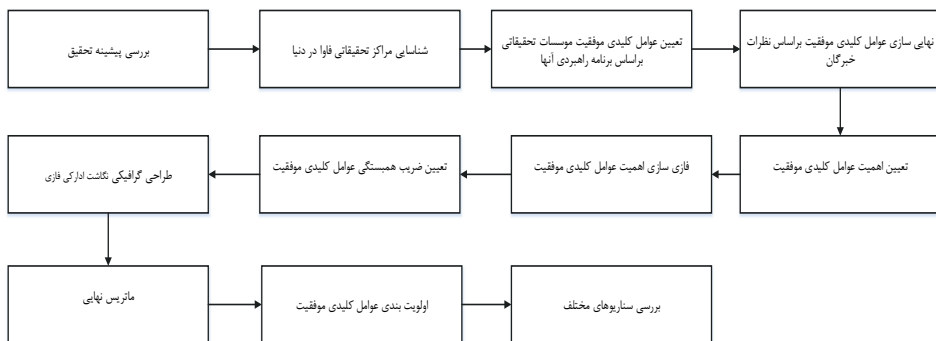
شکل ۱: فرایند اجرای پژوهش

مدل یا برخی مؤلفه‌های آن را در قالب آزمون آزمایشگاهی بررسی کرد، تعیین تجربی جهت علیت نیز امکان پذیر خواهد بود. اما در بسیاری از موارد از جمله مدل‌های اقتصادی، اجتماعی، سیاسی و همچنین مدل‌های کسب و کار امکان بررسی و آزمون آزمایشگاهی وجود ندارد و در چنین شرایطی جهت علیت توسط افراد خبره تعیین می‌شود. در گام آخر ماتریس نگاشت ادراکی فازی ایجاد می‌شود. بر این اساس پس از تشکیل ماتریس قدرت تأثیر، لازم است که نتایج به دست آمده توسط افراد خبره مورد بازنگری قرار گیرد، چراکه ممکن است برخی از داده‌های درون ماتریس، داده‌های گمراه‌کننده‌ای باشند. به بیان دیگر، با اینکه نتایج بر مبنای منطق ریاضی به دست آمده و احتمالاً مبین وجود رابطه و نزدیکی قابل قبول میان عوامل است، این احتمال نیز وجود دارد که از نظر منطقی، عوامل فاقد ارتباط حقیقی باشند. افراد خبره در این حوزه این ارتباطات نامناسب را به راحتی می‌توانند شناسایی و حذف کنند. بنابراین طی مصاحبه حضوری با افراد خبره در این زمینه، به صورت تعاملی در خصوص چگونگی وجود رابطه میان مؤلفه‌ها تصمیم‌گیری شد. مجموع تأثیراتی که بر یک عامل اعمال می‌شود، مجموع تأثیرات ورودی و مجموع تأثیراتی که یک عامل بر سایر عوامل می‌گذارد، مجموع تأثیرات خروجی عامل نامیده می‌شوند. حال اگر عوامل مؤثر بر حسب اثر خود یعنی مجموع اثرات ورودی و خروجی فهرست شوند، جدولی شامل کلیه شاخص‌ها به دست می‌آید (ادن ۱ و همکاران، ۱۹۹۲).