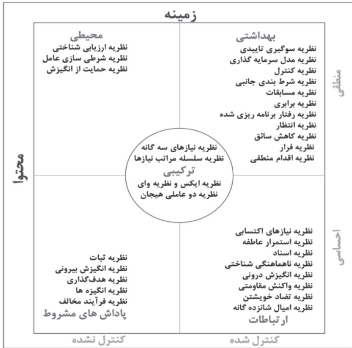
شکل ۱ - چارچوب نظری فریک (فریک، ۲۰۱۰)

فرصت برای پیشرفت و ارتباط با همکاران همگی ناملموس، مبتنی بر احساس و درونی هستند. عواملی همچون حمایت مدیریت، منابع ناکافی یا رفت و آمد دشوار به محل کار از محیط بیرون اثر می گیرند.